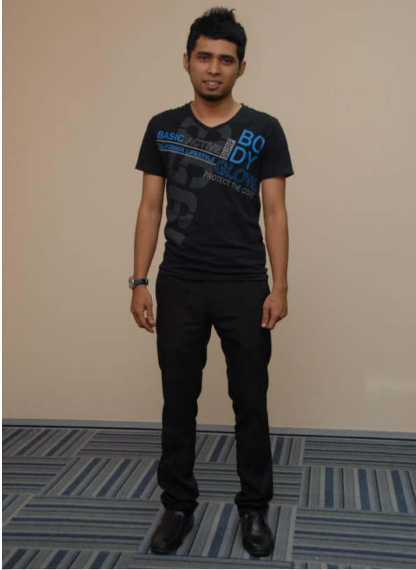
Baju casual (T-shirt, jeans)