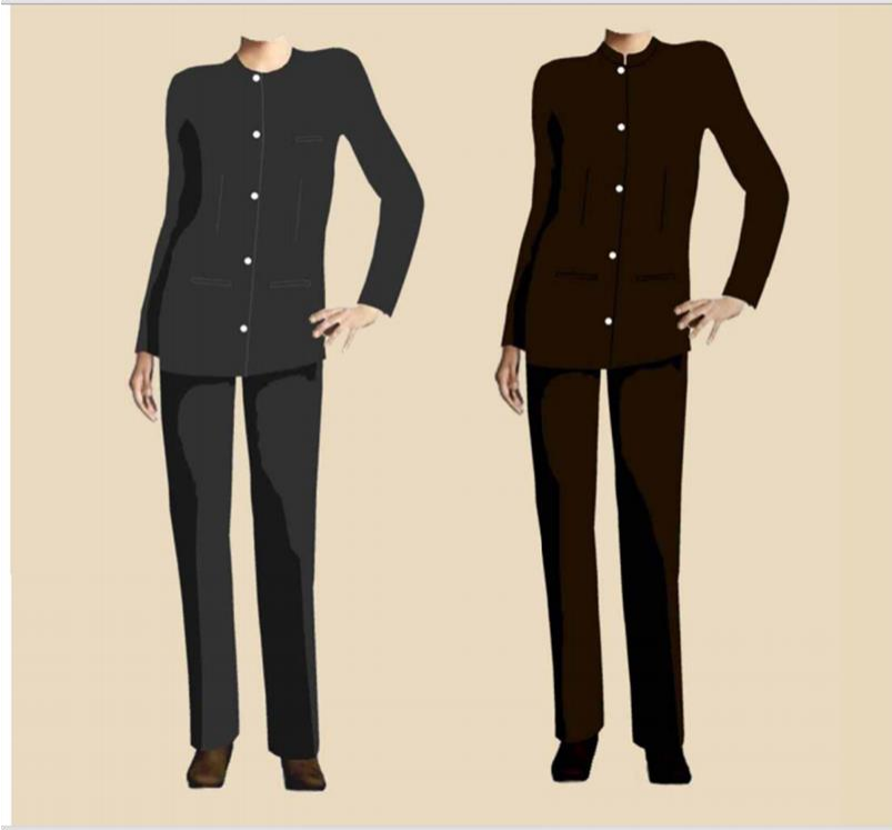
Two- Piece Pant Suit