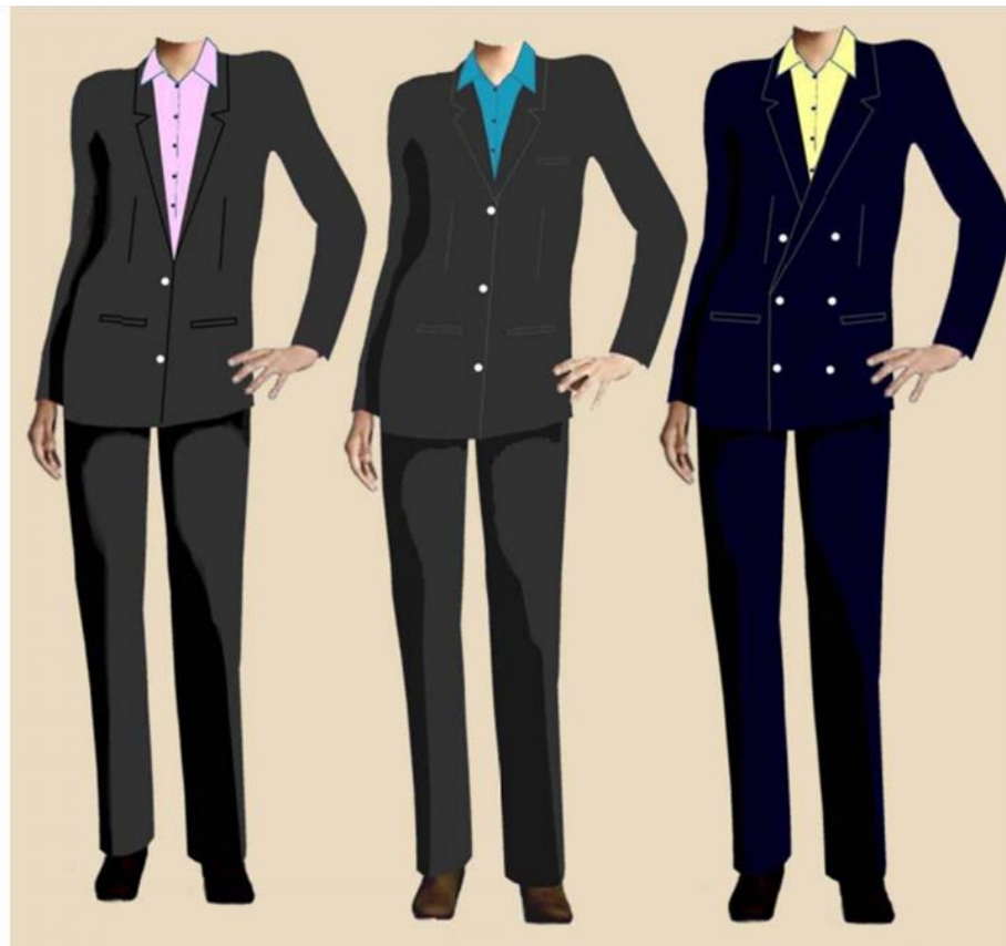
Three- Piece Pant Suit