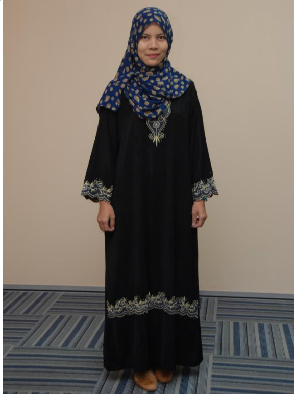
Jubah / Abaya