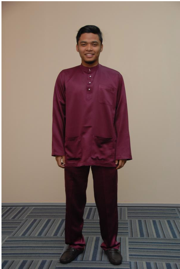
Baju melayu (tidak lengkap – tanpa samping dan songkok)