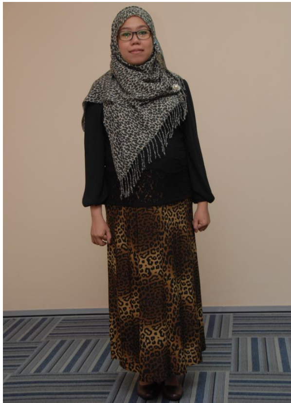
Skirt dan Blaus (kecuali mengandung)