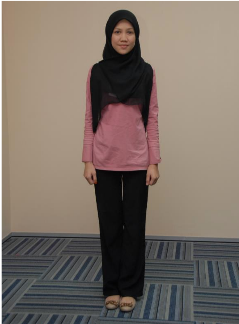
Seluar Panjang dan blaus tanpa jaket